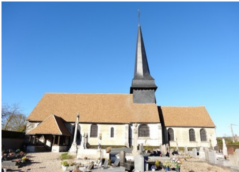
L'église de Surville

Les avis seront cohérents avec ceux émis ces dernières années, à savoir : pas de maisons à volume compliqué (type V, W, Y, ou Z), pentes à 45° pour les volumes principaux, ardoise ou tuile plate de teinte brun vieilli, à 20u/m 2 , avec un débord de toiture de 20cm, enduit de teinte beige clair avec modénatures (au choix : chaînages, encadrement de fenêtres, soubassement, colombage...). *Voir les autres fiches.