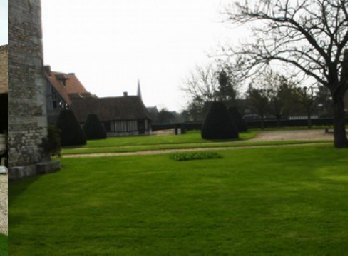
La vue vers l'Est et vers l'église