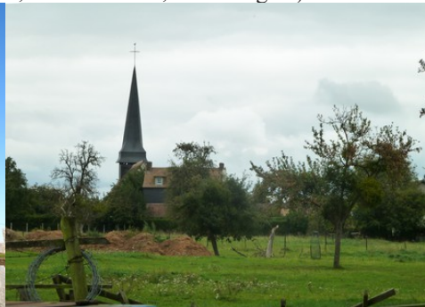
L'église vue depuis les vergers