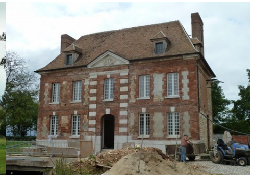
Un logis d'exploitation voisin