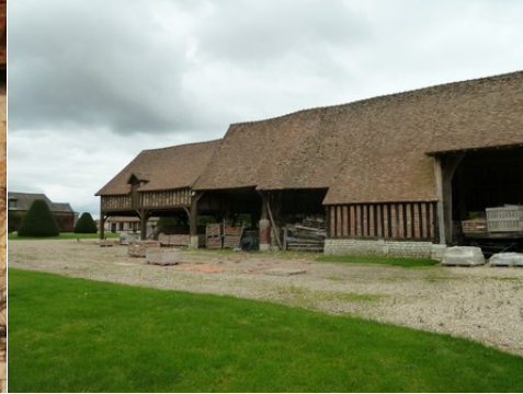
Les granges à pans de bois