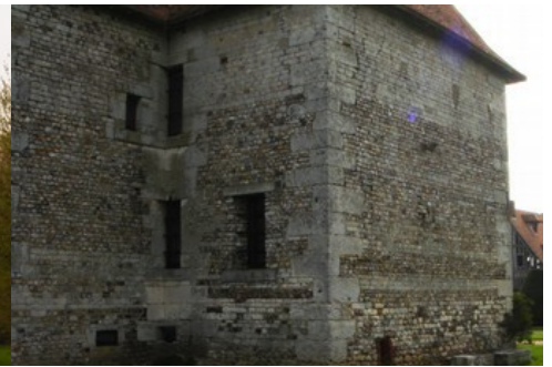
La façade Ouest du manoir (vue proche)