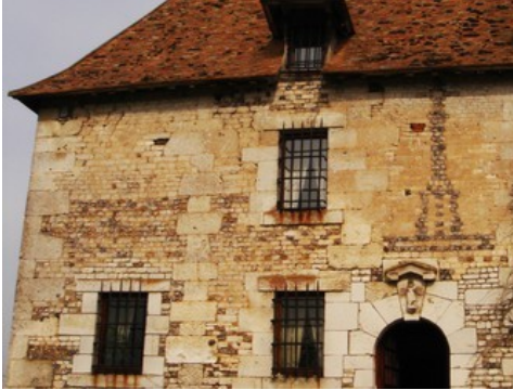
La façade Est du manoir (vue proche)