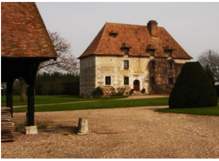
La façade Est du manoir